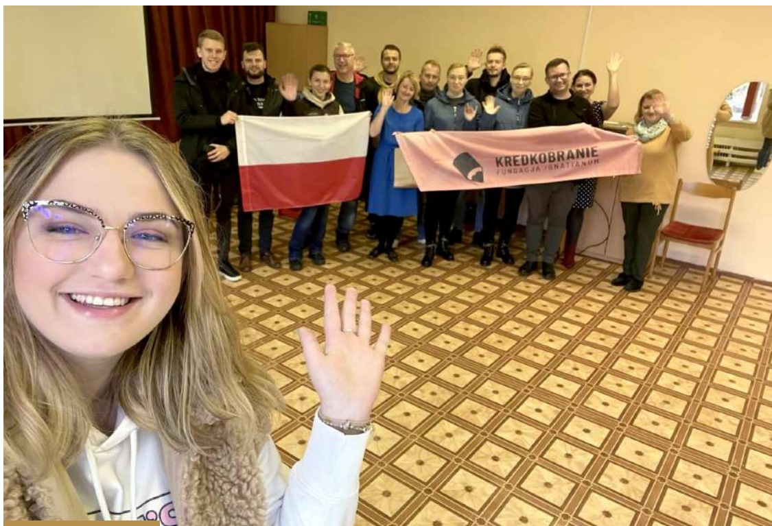
Z darami na Litwie

i wszelkie zaangażowanie organizatorzy serdecznie dziękują. Mają nadzieję, że wojna za wschodnią granicą jak najszybciej się zakończy i przyszłoroczna akcja powróci do poziomu minimum z 2021 roku, czyli do ponad 140 000 szt. zebranych darów o wartości ponad 1 mln zł, z ponad 500 placówek edukacyjnych.