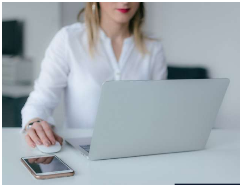
Moduł dla pracodawców pozwala m.in. na umieszczanie i udostępnianie ofert pracy

Moduł dotyczący szkoleń pozwala na udostępnianie i realizację szkoleń. System ten obsługuje szkolenia stacjonarne, jak i e-learningowe. W przypadku szkoleń tradycyjnych, pracownik ABK uruchamia zapisy na dane szkolenie, a w przypadku