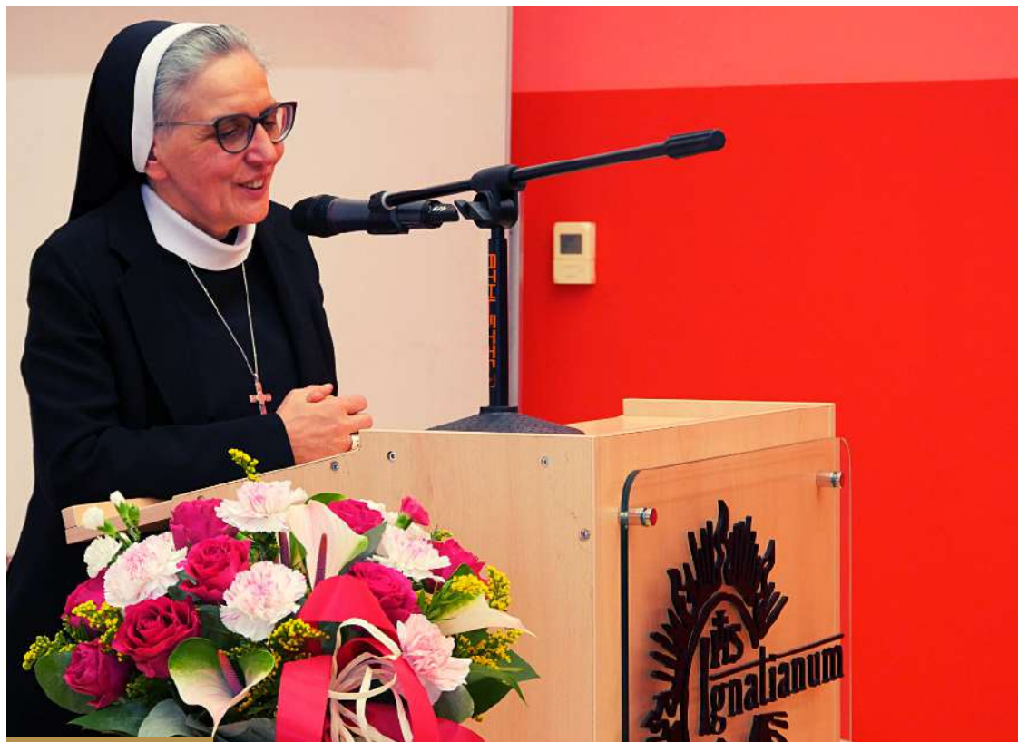
Wydarzenie było doskonałą okazją, by przypomnieć o życiu i licznych osiągnięciach naukowych Jubilatki

Seminarium Duchownym. Przez wiele lat pracowała jako katecheta w Częstochowie, Słupsku czy Krakowie. Od 2001 roku jako ekspert Ministerstwa Edukacji Narodowej wchodzi w skład komisji kwalifikacyjnych i egzaminacyjnych dla nauczycieli ubiegających się o awans zawodowy. Ponadto z mandatu Komisji Wychowania Katolickiego Konferencji Episkopatu Polski została powołana na rzeczoznawcę ds. oceny programów nauczania religii i podręczników katechetycznych. Aktualnie jest profesorem Akademii Ignatianum w Krakowie. W czasach, kiedy uczelnia nosiła nazwę Wyższej Szkoły Filozoficzno-Pedagogicznej „Ignatianum”, pełniła obowiązki organizacyjne i administracyjne będąc prodziekanem na Wydziale Pedagogicznym odpowiedzialnym za programy nauczania i studia