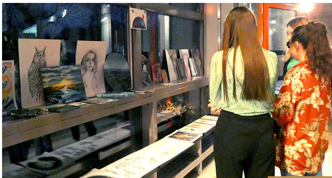
Twórczość plastyczną, jak i literacką mogliśmy oglądać w formie wystawy, w specjalnie zaaranżowanej przestrzeni obok Auli Wielkiej im. ks. Grzegorza Piramowicza SJ