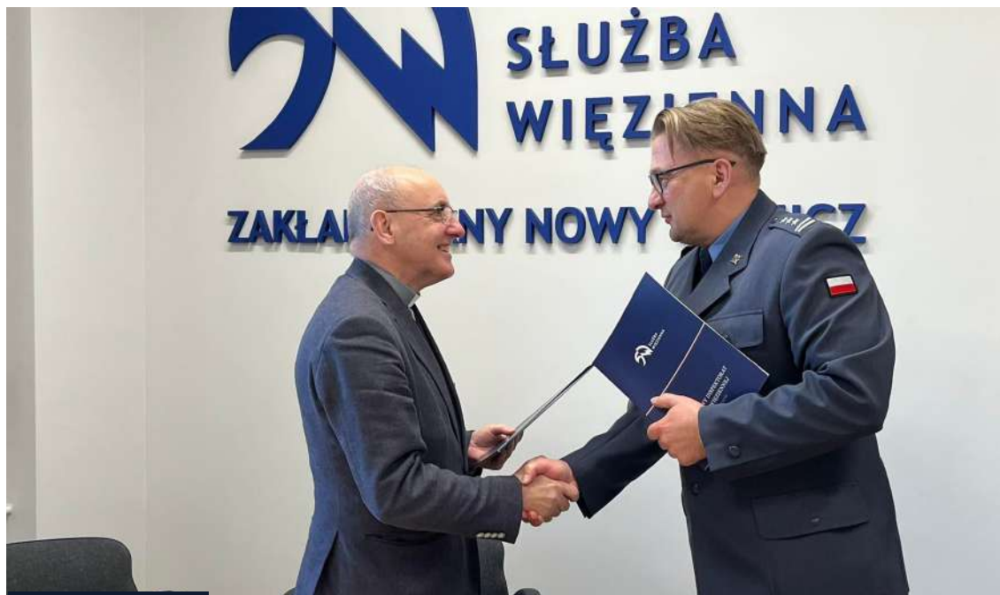
Współpraca pomiędzy OISW w Krakowie a AIK trwa od ponad 11