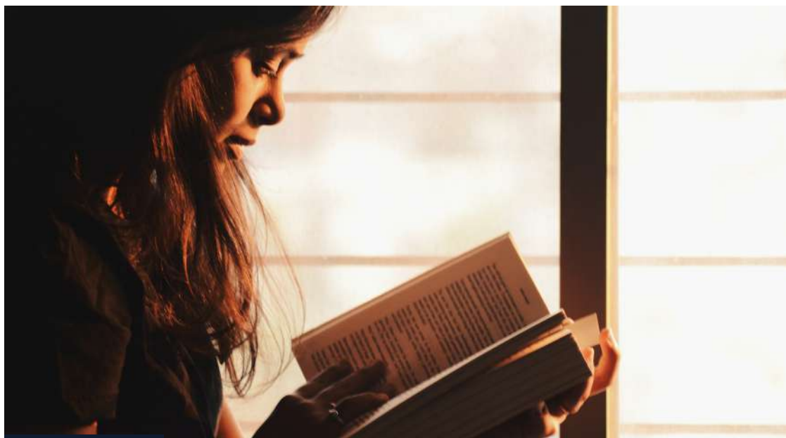
Celem etyków chrześcijańskich powinno być ukazywanie młodym ludziom piękna ewangelicznego słowa