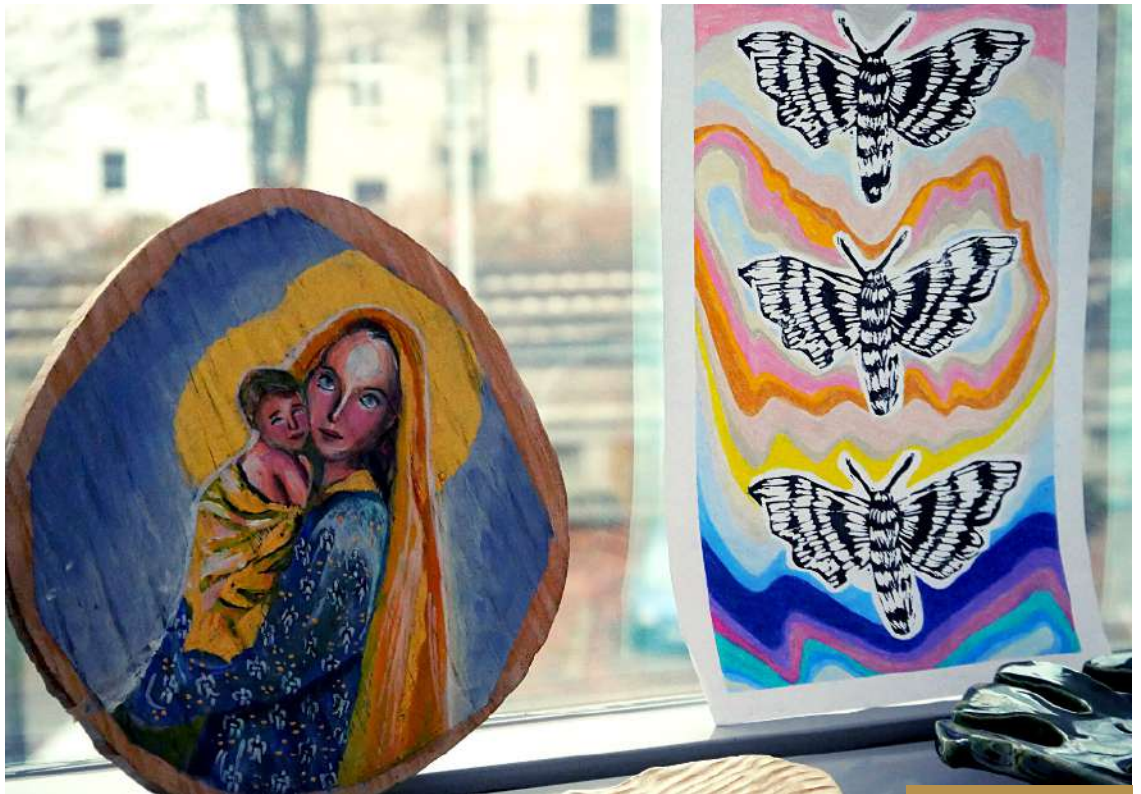
Prace zgłoszone do konkursu w kategorii sztuki plastycznej