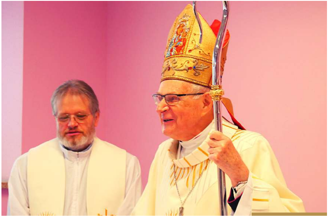
Uroczystość rozpoczęła Msza Święta w intencji Jubilatki, której przewodniczył ks. prof. bp Antoni Długosz

życiowa droga Czcigodnej Jubilatki, w tym osiągnięcia naukowe, publikacje, wygłoszone referaty, udział w konferencjach i projektach oraz działalność dydaktyczna, organizacyjna, administracyjna – w pewnym zakresie świadczą o tym, co możemy określić jako wzniosłe, cenne, doskonałe, perfekcyjne w jej życiu. Równocześnie wskazują, że realizacja życiowych i zawodowych sukcesów, dążenia do celu, wymaga również trudu, poświęcenia, godzin żmudnej pracy i zaangażowania. Można więc pogratulować zarówno Rodzinie, jak i Zgromadzeniu zakonnemu za stworzenie takiego środowiska, które umożliwiło Siostrze Profesor osobiste spełnianie się oraz realizację życiowego powołania. Wszystkim uczestnikom uroczystości jubileuszowej dało natomiast okazję do przypomnienia najważniejszych dokonań i osiągnięć Siostry Profesor.