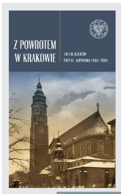
Z powrotem w Krakowie. 150 lat jezuitów przy ul. Kopernika (1868–2018); źródło: Wydawnictwo Naukowe Akademii Ignatianum w Krakowie

Koniec 2022 roku przyniósł interesującą publikację o charakterze interdyscyplinarnym, którą warto odnotować ze względu na jej szczególny charakter oraz poruszaną tematykę. Jej wydanie łączy się z ważnymi dla całej społeczności ignacjańskiej rocznicami. Monografia nawiązuje przede wszystkim do obchodzonej w 2018 roku 150 rocznicy powrotu jezuitów do Krakowa.