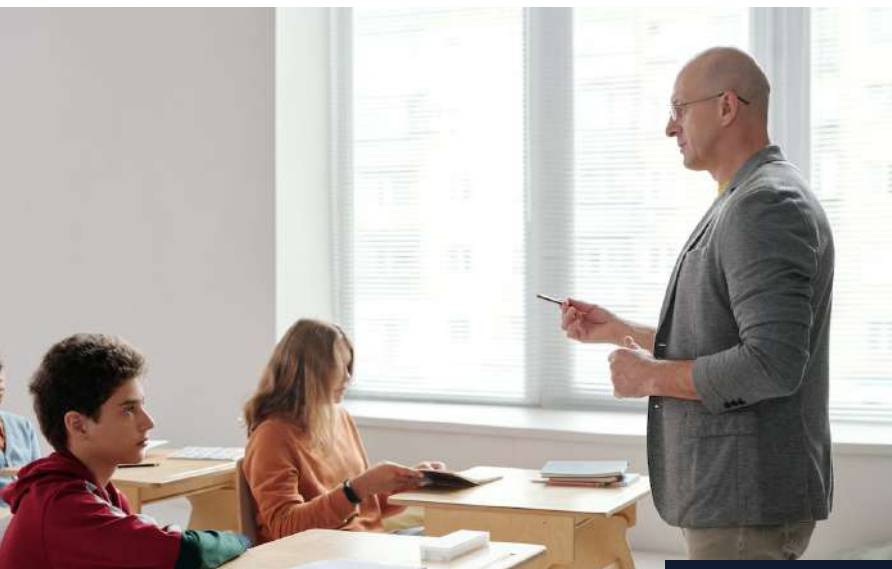
Projekt ma na celu promocję i popularyzację kapitału etycznego przede wszystkim wśród nauczycieli szkół podstawowych i średnich

Można założyć, że etyk chrześcijański to osoba, której nadrzędnym celem powinno być zrozumienie drugiego człowieka nawet, jeśli myśli on odmiennie. Chodzi o zrozumienie pozorne, ale i o takie, które angażuje poznawczą i emocjonalną empatię. Ideą takiego podejścia jest okazanie należnego szacunku, życzliwości oraz pojmowania dla drugiego człowieka, jego sposobu myślenia i stylu bycia, gdyż posiada on zupełnie inny obraz świata i bagaż doświadczeń życiowych. Nauczyciel etyki ma być terapeutą duszy, ale tylko dla tych, którzy tego chcą, którzy przychodzą i mówią: chciałbym poznać wartości kryjące się w kapitale etycznym chrześcijaństwa. Przymuszanie tych, którzy nie są zainteresowani tym zagadnieniem mija się z celem i zawsze przyniesie skutki odwrotne od zamierzonych. Metody przymusu stosują ludzie słabi i załękni, którzy sami nie są pewni ani swojej wiary, ani żywionych przekonań moralnych wobec czego poszukują czegoś, co je wzmocni. Promocja chrześcijańskiego kapitału etycznego to przede wszystkim promowanie postaw, które mają swoje korzenie w ewangelicznym słowie Jezusa. Słowo to przynosi pokój i radość oraz daje nadzieję, ale nie usuwa nieporozumień i przeciwności.