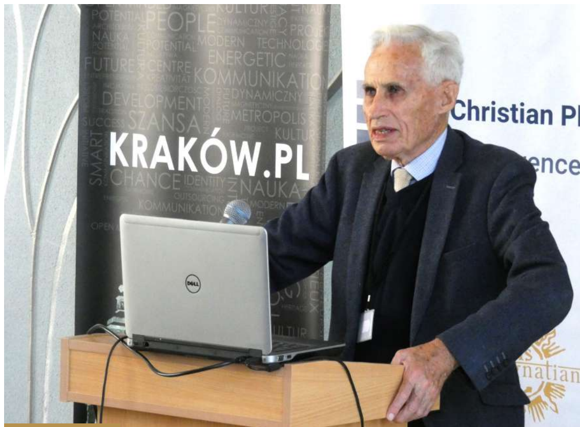
Richard Swinburne z Oxford University w Wielkiej Brytanii podczas wystąpienia na konferencji

Obrady odbywały się w trzech równoległych sekcjach, z których każda miała po 4 sesje z 3 lub 4 prelegentami znajdującymi się w salach fizycznie bądź online. Wszystkie referaty, wykłady i dyskusje były transmitowane na portalu YouTube AIK, gdzie wciąż są dostępne do odsłuchania. Oprócz obrad, w programie przewidziano bankiet w jednej z krakowskich restauracji oraz możliwość zwiedzania Starego Miasta i Kazimierza z przewodnikiem, co dodatkowo zintegrowało i pogłębiło relacje pomiędzy obecnymi w Krakowie uczestnikami konferencji, którzy stanowili większość zainteresowanych. Organizacja tego wydarzenia spotkała się z wieloma wyrazami uznania i wdzięczności. Konferencja potwierdziła, że AIK jest w stanie tworzyć duże, skomplikowane, globalne wydarzenia i posiada wielki potencjał zarówno naukowy, jak i organizacyjny. Z okazji konferencji ukazało się wiele materiałów prasowych w mediach świeckich i katolickich. Do uczelnianego czasopisma „Forum Philosophicum” napłynęło kilkanaście artykułów opartych na konferencyjnych referatach.